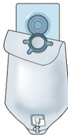
Рисунок 2. Присоединение стомного мешка к клеевой пластине