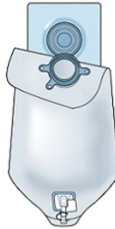
Рисунок 2. Присоединение стомного мешка к клеевой пластине