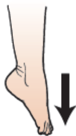
Рисунок 14. Пальцы ног обращены вниз