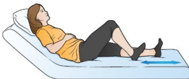
Рисунок 1. Скольжение пятками