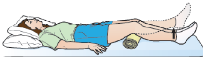
Рисунок 2. Упражнение на квадрицепс бедра с неполной амплитудой