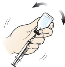
Рисунок 4. Смешивание глюкагона в виде порошка с жидкостью

Раствор должен быть прозрачным и бесцветным. В результате смешивания могут образоваться пузырьки воздуха. Это нормально. Не используйте лекарство, если оно мутное или в нем видны твердые частицы, которые не растворяются после смешивания. Немедленно позвоните 911.