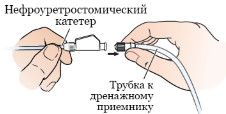
Рисунок 2. Отсоединение дренажной трубки от катетера