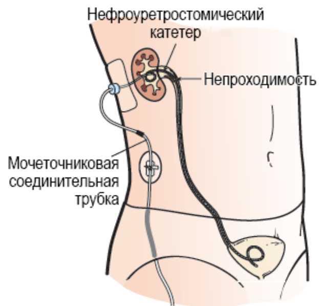
Рисунок 1. Нефроуретростомический катетер