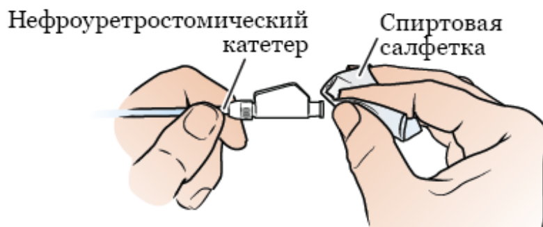
Рисунок 3. Очистка конца нефроуретростомического катетера