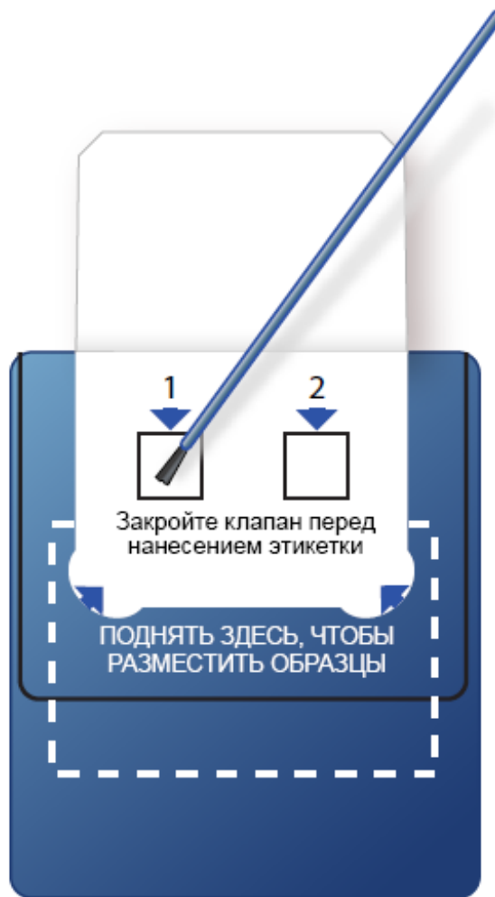
Рисунок 3. Потрите щеточкой внутри квадрата под номером «1».