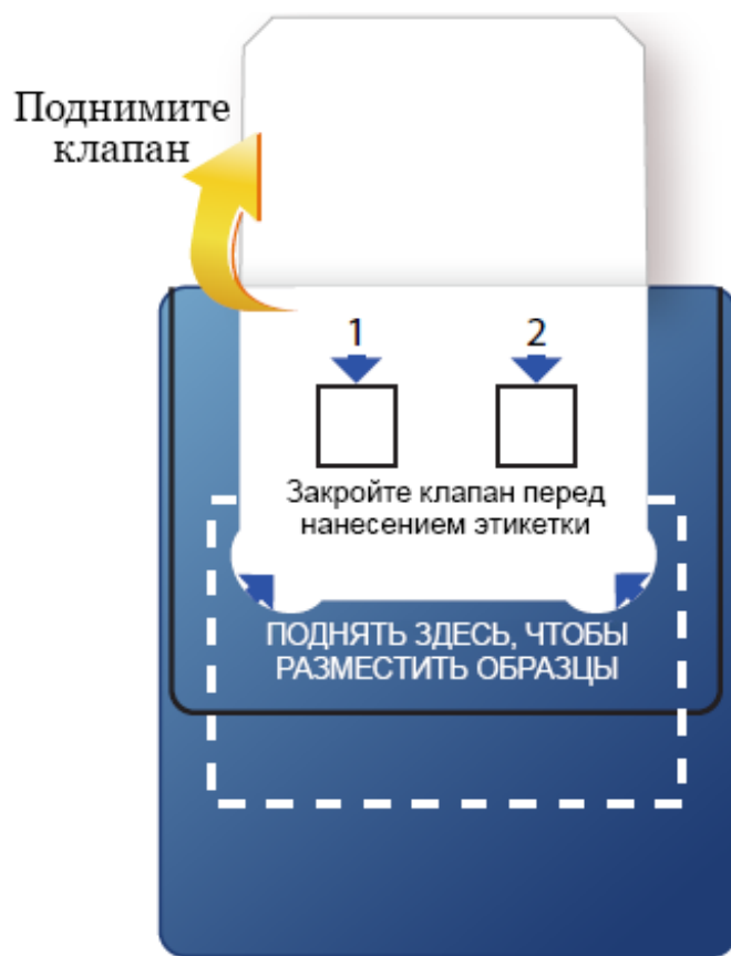
Рисунок 1. Поднимите клапан диагностической карты.

Чтобы взять образец стула и провести FIT, выполните описанные ниже действия.