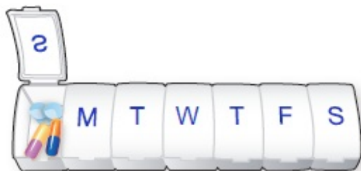
Рисунок 2. Пример таблетницы

Большинство таблетниц не имеют защиты от детей. Если в вашем доме есть ребенок, храните таблетницу в недоступном для детей месте.