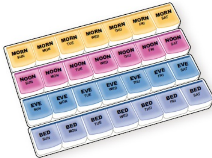
Рисунок 1. Пример таблетницы