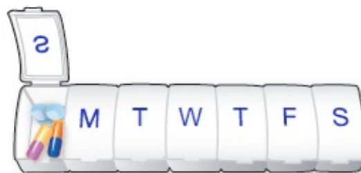
Рисунок 2. Пример таблетницы

Большинство таблетниц не имеют защиты от детей. Если в вашем доме есть ребенок, храните таблетницу в недоступном для детей месте.