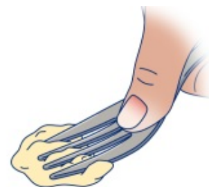
Рисунок 3. Проверка надавливанием вилкой

Положите вилку на продукт. Большим пальцем надавите на вилку (см. рисунок 3). Ваш продукт является достаточно мягким, если он полностью раздавлен и не возвращается в исходную форму.