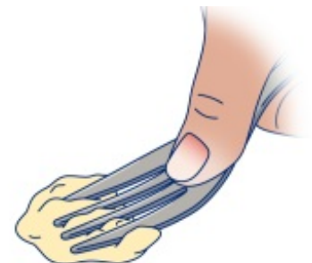
Рисунок 3. Проверка надавливанием вилкой

Положите вилку на продукт. Большим пальцем надавите на вилку (см. рисунок 3). Ваш продукт является достаточно мягким, если он полностью раздавлен и не возвращается в исходную форму.