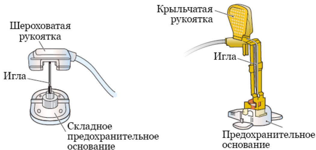
Рисунок 2. Примеры фиксации иглы в безопасном положении