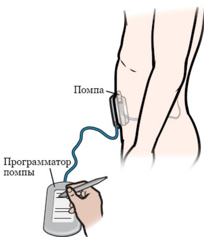
Рисунок 2. Программирование помпы

Если в вашей помпе заканчивается лекарство, она