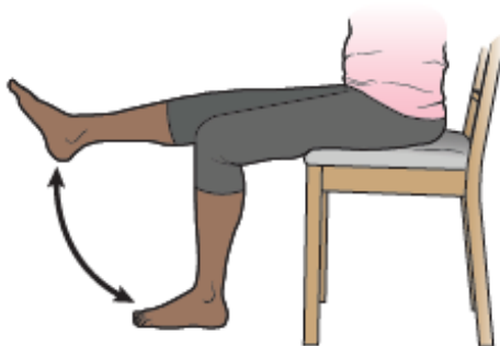
Рисунок 4. Махи ногами в положении сидя