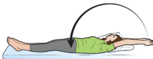
Рисунок 7. Поднятие рук над головой