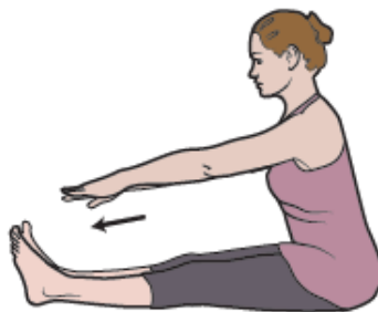
Рисунок 8. Растяжка ног