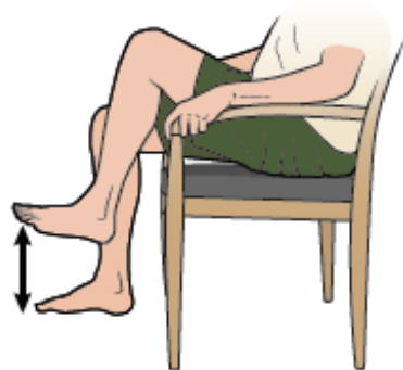
Рисунок 3. Ходьба на месте