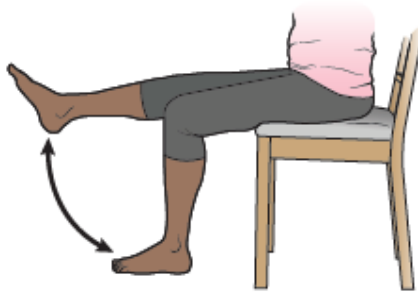
Рисунок 4. Махи ногами в положении сидя