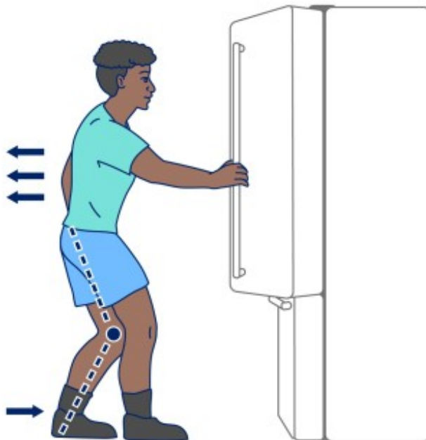
Рисунок 12. Перенесите одну ногу назад, согните колено этой ноги и возьмите предмет