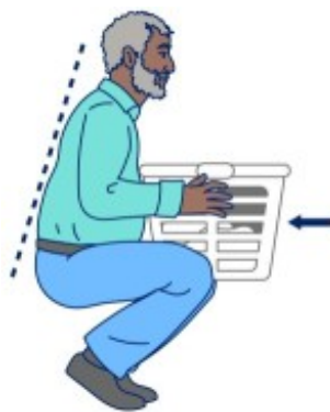
Рисунок 3. Поднимите предмет близко к телу.