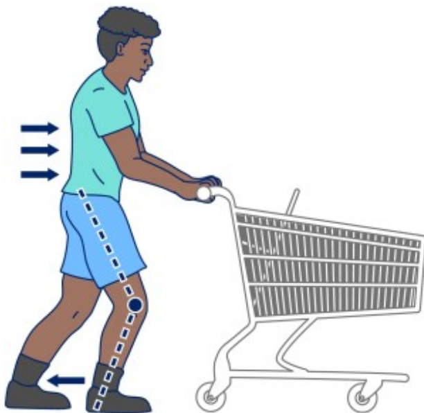
Рисунок 11. Перенесите одну ногу вперед, согните колено этой ноги и положите руки на предмет.