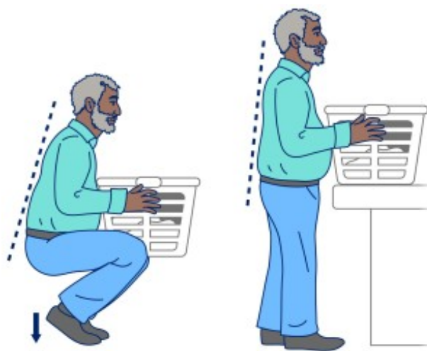
Рисунок 4. Оттолкнитесь пятками, чтобы встать

Подъем в положение стоя из положения полустоя на одном колене