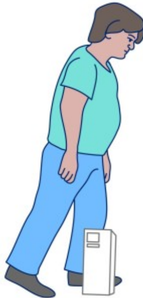
Рисунок 5. Поставьте одну ногу рядом с предметом, а другую отведите в сторону и назад