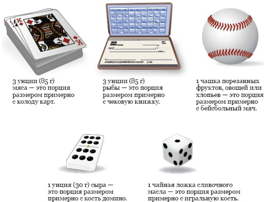
Рисунок 3. Примеры размеров порций