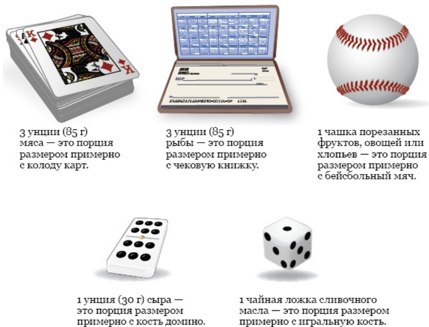
Рисунок 3. Примеры размеров порций

Для определения размера порций используйте обычные бытовые предметы, примеры которых приводятся ниже (см. рисунок 3).