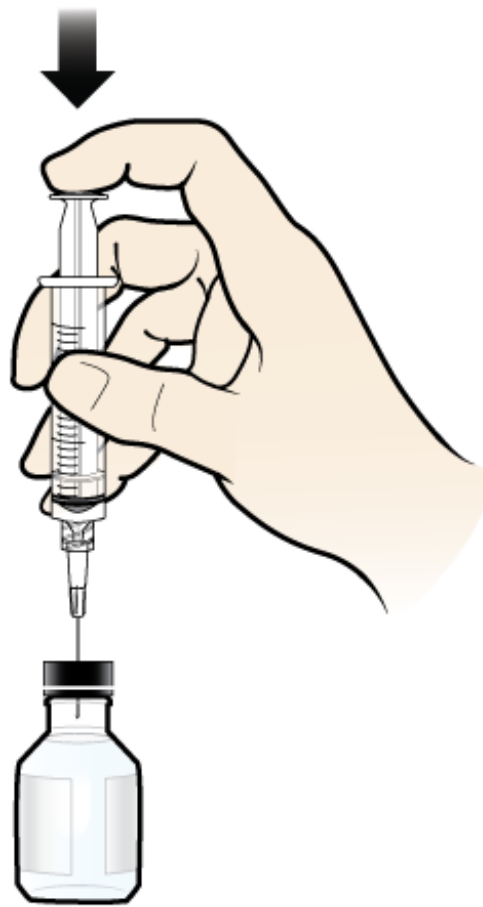
Рисунок 1. Введение воздуха во флакон