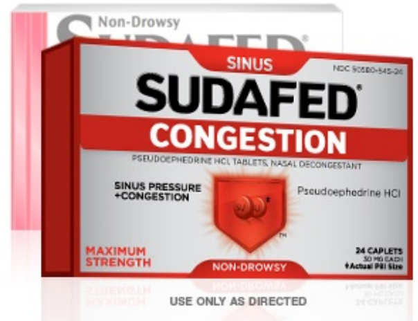
Рисунок 4. Псевдоэфедрина гидрохлорид

Отнесите провизору карточку псевдоэфедрина гидрохлорида (pseudoephedrine HCl), которая висит на полке (см. рисунок 4). Вам придется предъявить удостоверение личности с фотографией, прежде чем провизор продаст вам упаковку этого препарата.