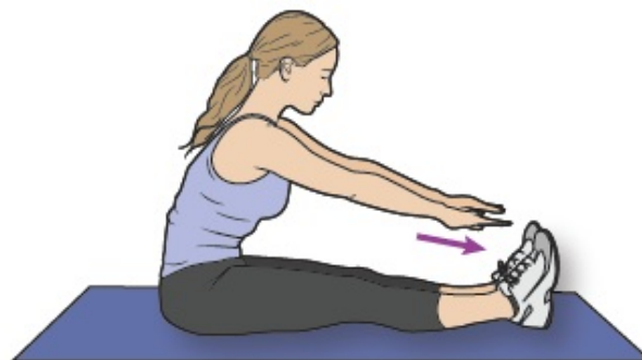
Рисунок 5. Растяжка мышц задней поверхности бедра