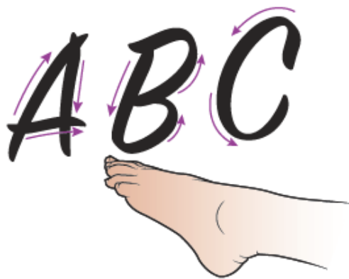
Рисунок 3. Алфавит для щиколотки

Двигайте ступней так, как будто вы пишете буквы алфавита (см. рисунок 3). Напишите буквы каждой ногой минимум по 2 раза.