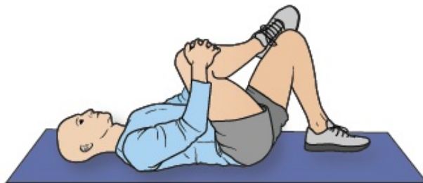
Рисунок 6. Растяжка мышц бедер