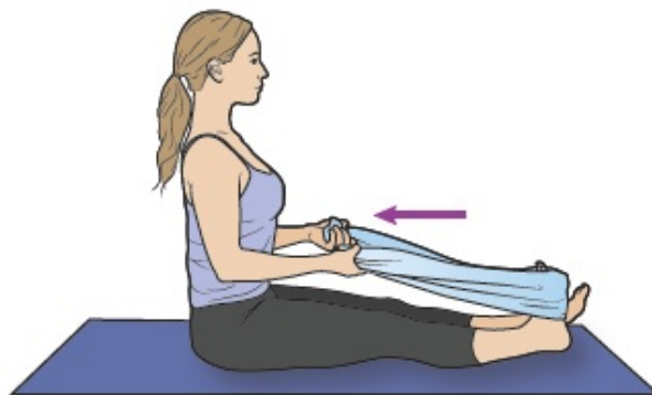
Рисунок 4. Растяжка голеней