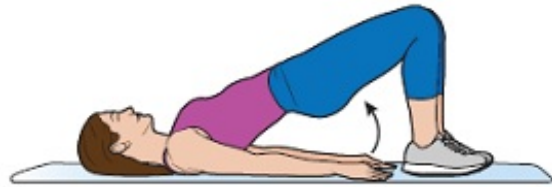
Рисунок 8. Поднятие ягодиц