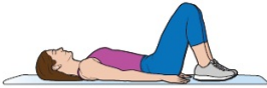
Рисунок 7. Положение лежа на спине с согнутыми в коленях ногами