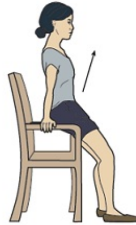
Рисунок 10. Приподнимание со стула с опиранием на подлокотники