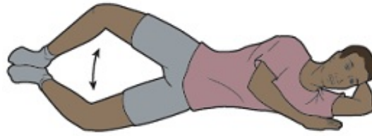
Рисунок 11. Упражнение «Раскладушка»

Если у вас возникли вопросы, обратитесь непосредственно к сотруднику своей медицинской бригады. Пациенты MSK могут обратиться к поставщику услуг после 17:00 либо в выходной или праздничный день, позвонив по номеру 212-639-2000.