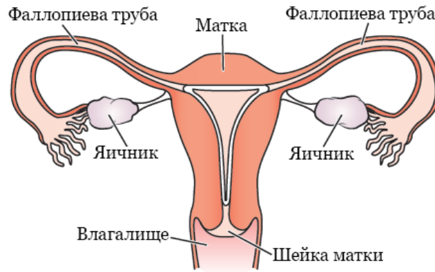
Рисунок 1. Ваша репродуктивная система

Если вы хотите иметь биологических детей в будущем, попросите своего медицинского сотрудника направить вас к специалисту-репродуктологу.