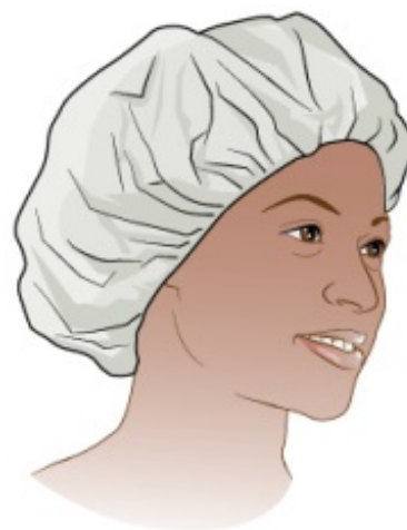
Рисунок 5. Одноразовая шапочка для волос