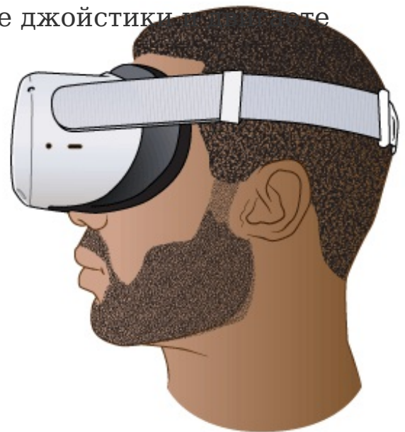
Рисунок 1. Использование VR-шлема