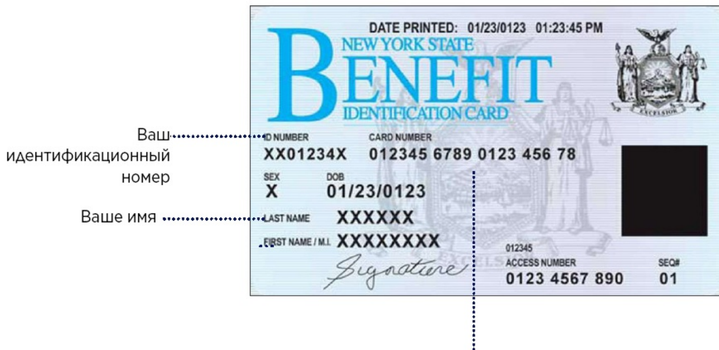
Рисунок 4. Информация, указанная на вашей карте страхового покрытия по программе Medicaid штата Нью-Йорк.

Чтобы задать вопросы о вашем страховом покрытии и плане страхования, позвоните в отдел по обслуживанию клиентов (Member Services) по номеру, указанному на обратной стороне любой карты медицинского страхования. У вас могут возникнуть вопросы о счетах, которые вы получаете по почте, или вам может потребоваться помощь в поиске поставщика медицинских услуг. В этом может помочь отдел по обслуживанию клиентов. Ваши карты медицинского страхования штата Нью-Йорк и все документы будут на английском языке.