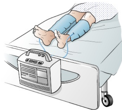
图 3. 腿部 SCD 套筒