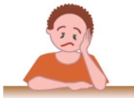
感觉虚弱或非常疲倦