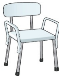
图 2. 带扶手和靠背的淋浴椅