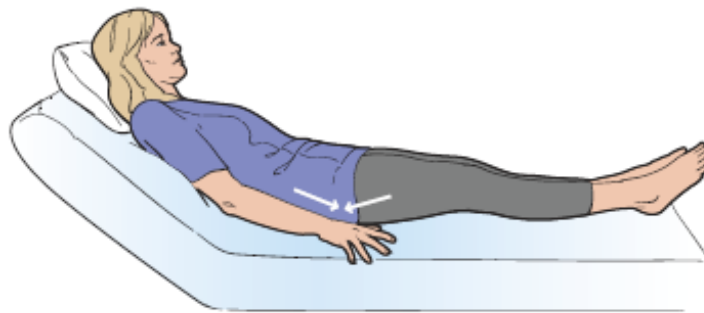
图 3. 臀肌动作组