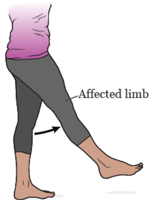
图 2. 屈髋