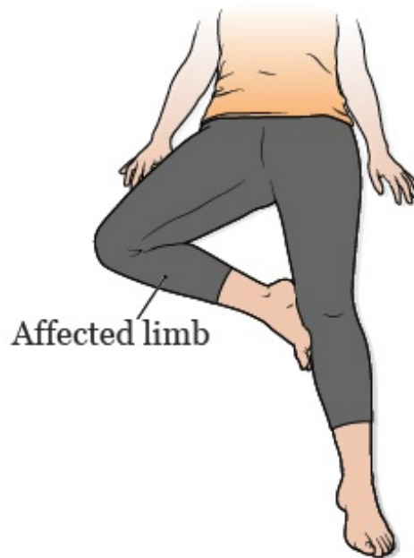
图 1. 蛙式体位