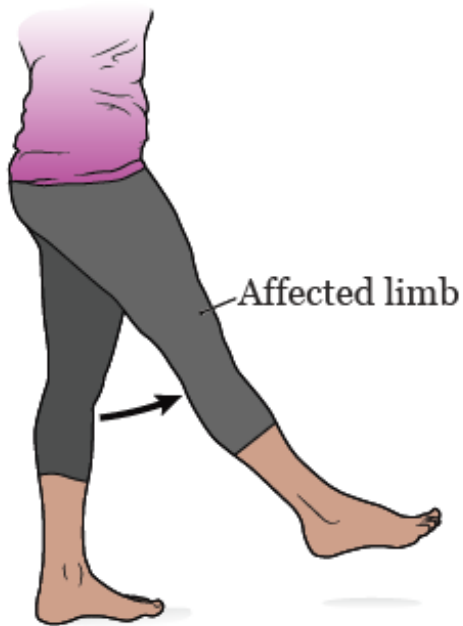
图 2. 屈髋