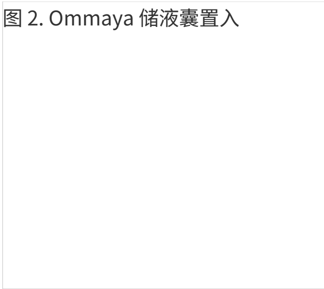
图 2. Ommaya 储液囊置入