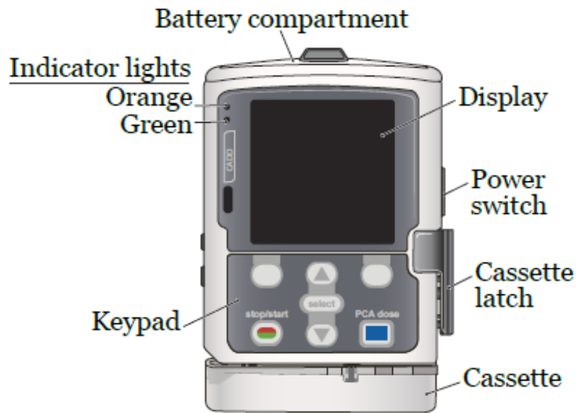
图 1. CADD-Solis VIP 输注泵

CADD-Solis VIP 输注泵是一种小型的电池驱动泵。该泵可以通过静脉（见图 1）来输送液体、药物并用于化疗。