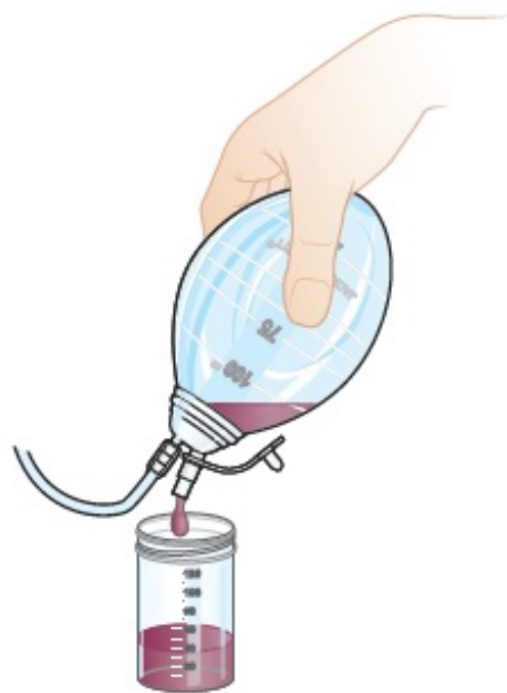
图 2. 排空球部