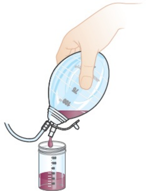
图 2. 排空球部