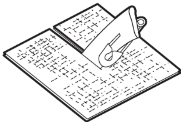
图 1. 彭罗斯氏引流管

彭罗斯氏引流管的一部分将置入人体。引流管的一端或两端将从切口伸出。部分血液和液体会从引流管流出，流到周围的敷料（纱布绷带）上。通常会在引流管末端留一个安全别针或小标签，以防止其滑入伤口（见图 1）。