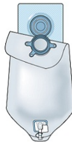
图 2. 将造口袋固定在底盘上