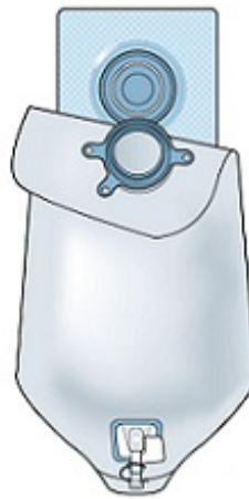
图 2. 将造口袋固定在底盘上