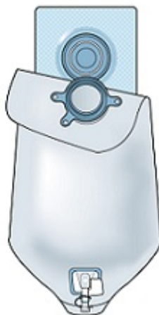
图 2. 将造口袋固定在底盘上