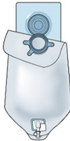
图 2. 将造口袋固定在底盘上