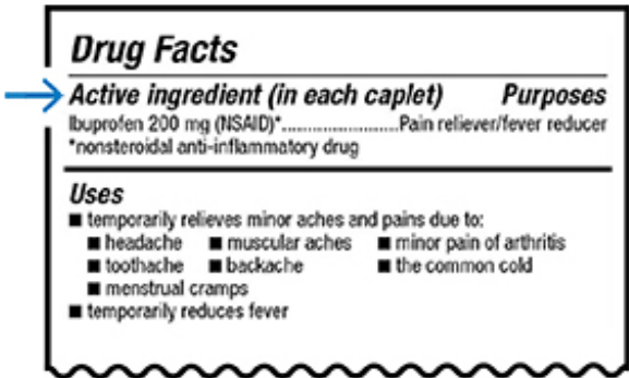
图 1. 非处方药标签上的活性成分

非处方药的“药品说明”标签中列出了其活性成分（见图 1）。 活性成分一般是药品说明标签上的第一项内容。