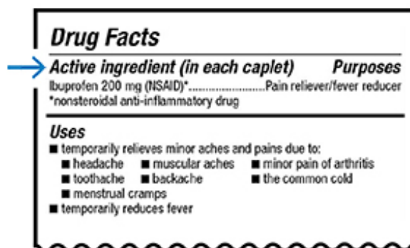
图 1. 非处方药标签上的活性成分

非处方药的“药品说明”标签中列出了其活性成分（见图 1）。活性成分一般是药品说明标签上的第一项内容。