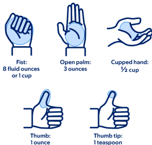
图 4. 如何用手测量食物份量

请使用量勺、量杯或食物秤测量食物。您也可以使用图 4 中的指南来估计一些食物的量。