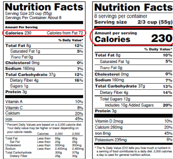
图 5. 在哪里可以找到营养成分表标签上的卡路里信息

有的食品可能没有营养成分标签。在这种情况下，您可以在营养资源网站上查找卡路里信息，如 CalorieKing.com 或 MyFitnessPal.com。您还可以将 MyFitnessPal 应用程序下载到您的智能手机上。