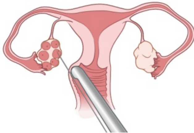
图 3. 取卵

取出的卵子将立即被冷冻，以备将来使用。卵子可以以未受精卵子的形式冷冻，也可以以受精后形成胚胎的形式（体外受精）冷冻。您可以根