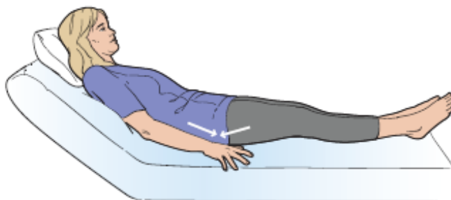
图 4. 臀肌动作组