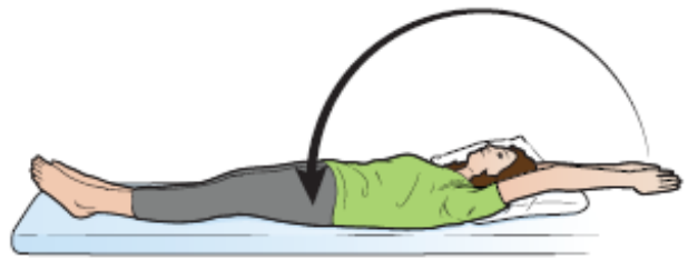
图 11. 头上方伸展