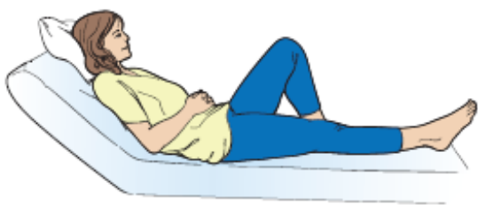
图 6. 弯曲腿部。