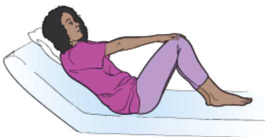
图 8. 伸出手臂