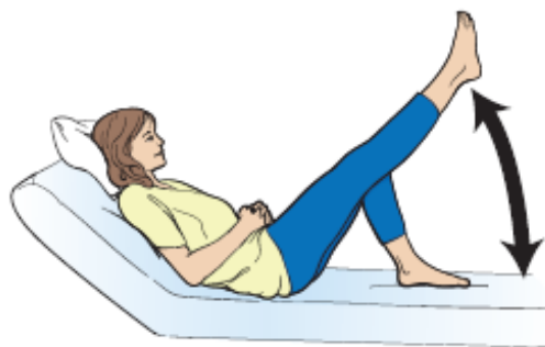
图 7. 抬升腿部。