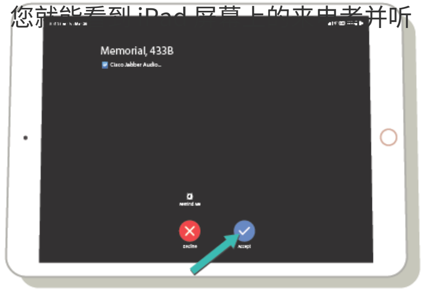
图 3. 显示视频来电的 iPad

当您碰触“接受”选项后，您就能看到 iPad 屏幕上的来电者并听到他们的声音。来电者也将能够看到您并听到您的声音，您可以像往常一样与他们交谈。请保持好 iPad 的位置，确保来电者可以看到您的脸。