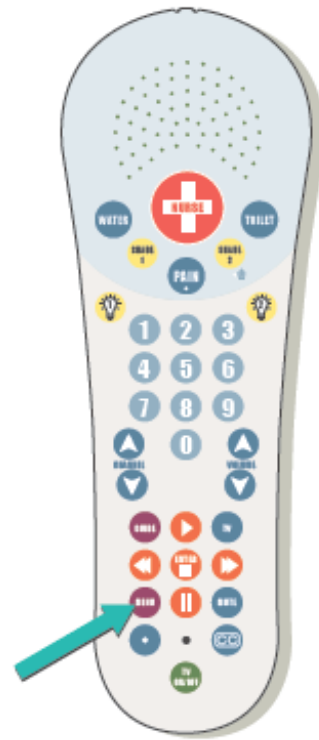
图 2. 遥控器上的“菜单”按钮

如要接听视频电话，请按下遥控器上的“菜单”按钮（参见图 2）。您会在电视上看到来电者，并通过遥控器上的扬声器听到他们的声音。来电者也能看到您，并听到您的声音。您可以像往常一样和他们交谈。