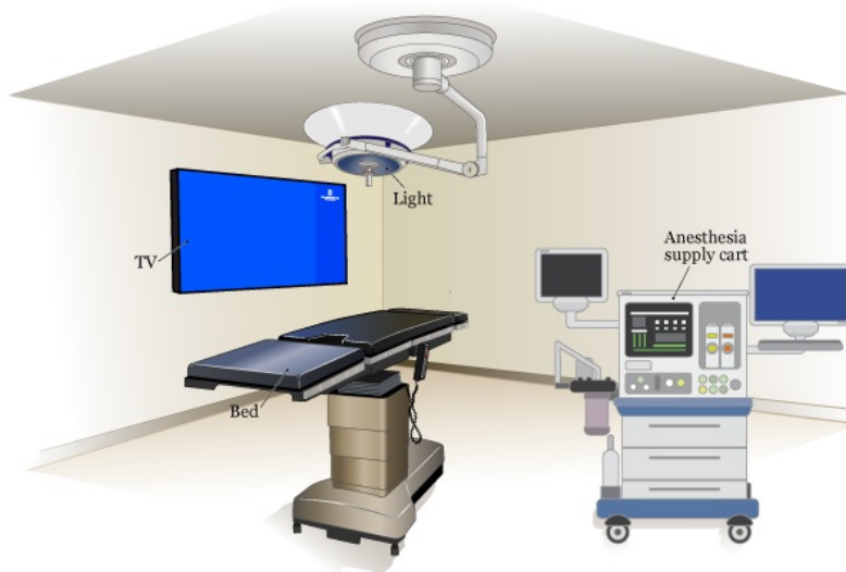
图 1. 检查室