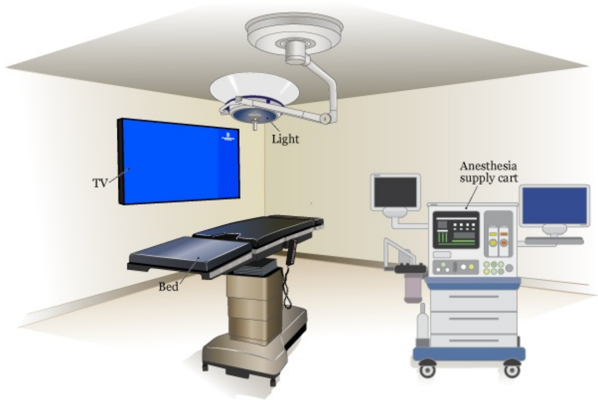
图 1. 检查室