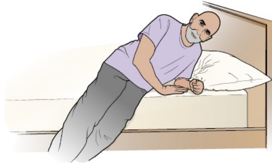
图 2. 用手臂帮助自己坐起来