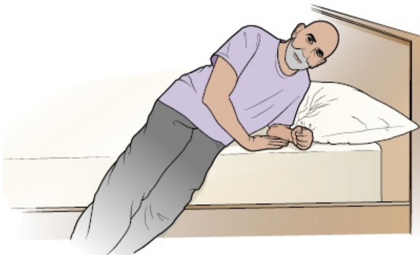
图 2. 用手臂帮助自己坐起来