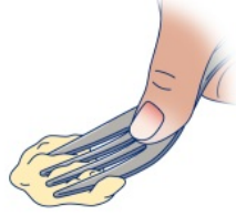
图 3. 叉子压力测试

将叉子抵在食物上。用拇指压住叉子（见图 3）。如果食物可被完全压扁且不会恢复原状，则表示食物足够柔软。