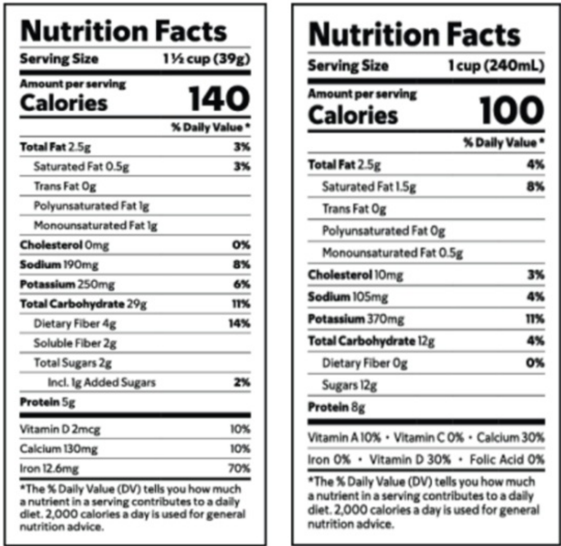
图 4. Cheerios 麦片（左）和 1% 低脂牛奶（右）的营养成分标签

第 4 步：将每种碳水化合物来源的克数相加，计算碳水化合物的总量。例如，一份 Cheerios 麦片和 1 杯 1% 牛奶的碳水化合物含量为 41 克（见图 4）。