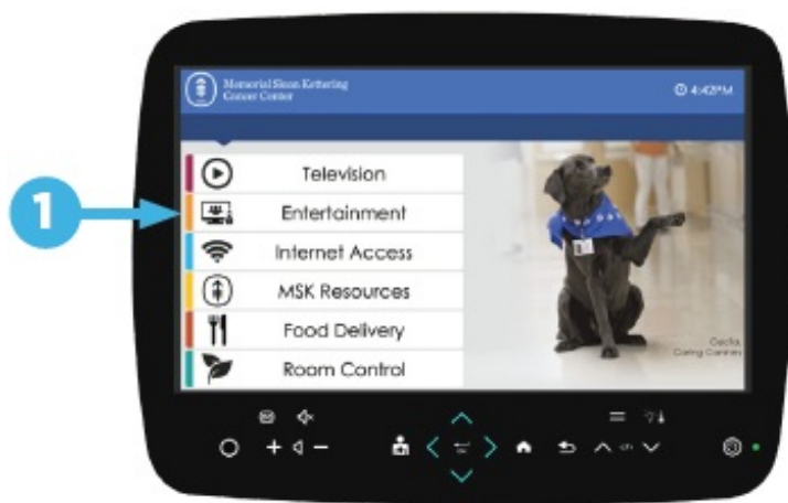
图 1. 选择“娱乐”

您的病房可能会配备一个带有 Skype 应用程序的交互式触摸屏设备。如果是的话，您可以使用该设备给您的家人或朋友拨打视频电话。您可以通过选择“娱乐”选项，然后选择“Skype”来访问 Skype 应用（参见图 1 和图 2）。