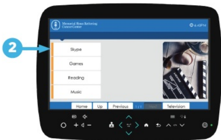
图 2. 选择 “Skype”