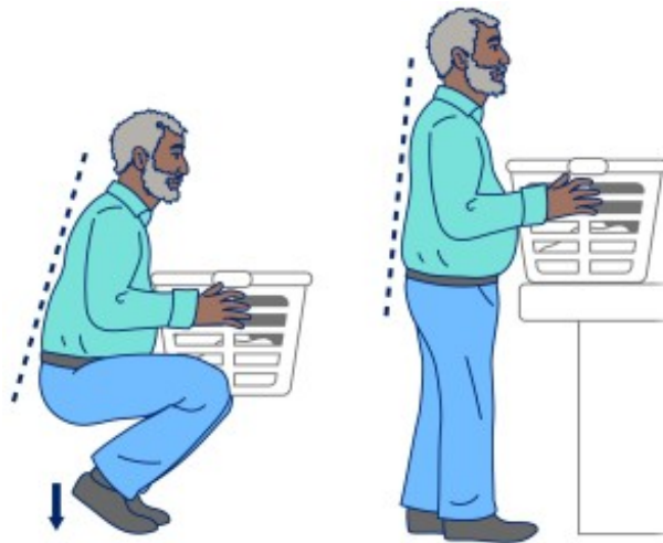
图 4. 通过脚跟发力，直到站立起来