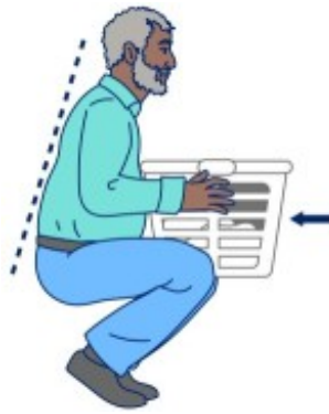
图 3. 将物品紧贴身体