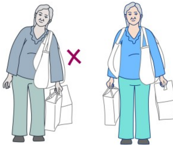
图 10. 将重量平衡在身体两侧