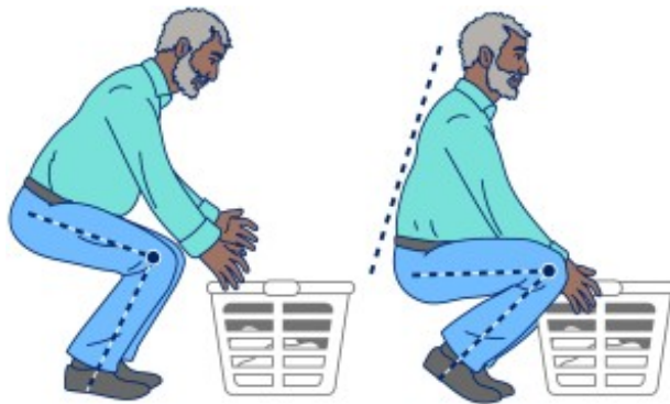
图 2. 弯曲膝盖，保持胸部挺起、背部挺直