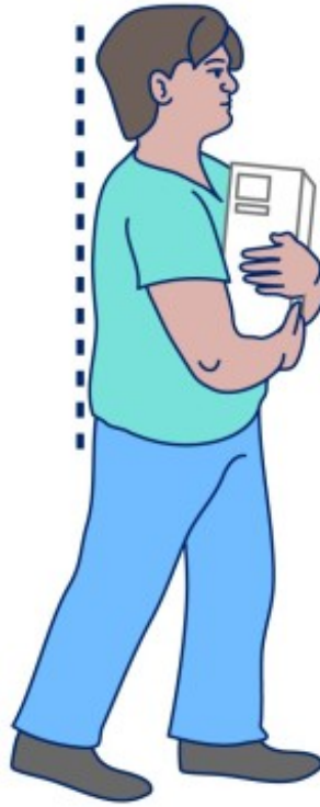
图 8. 通过脚跟 和脚趾发力站起 来