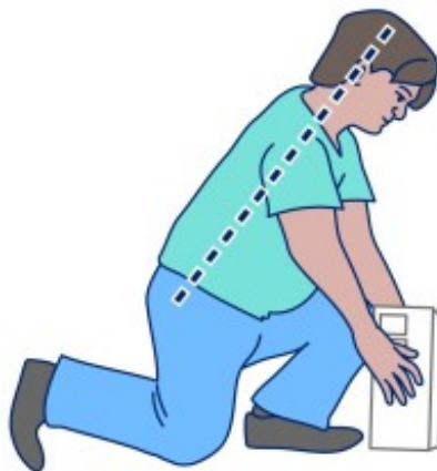
图 6. 下蹲直到后膝触地