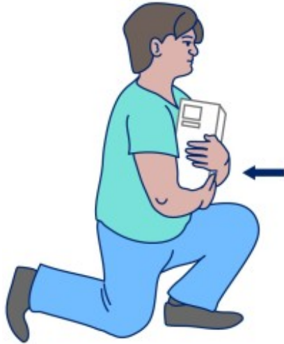
图 7. 将物品紧贴身体