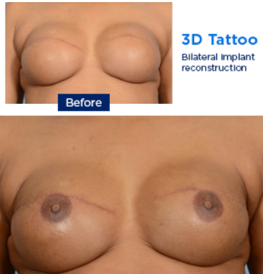
3D 纹身：双侧植入物重建

此页面包含带有乳头纹身和乳晕纹身的乳房的医学图解照片。皆为患者接受手术前后的照片。MSK 的医生助理接受过专业培训，可为乳腺癌手术中切除乳头和乳晕的患者制作乳头和乳晕纹身。