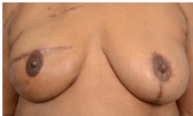
3D 纹身：右侧植入物重建