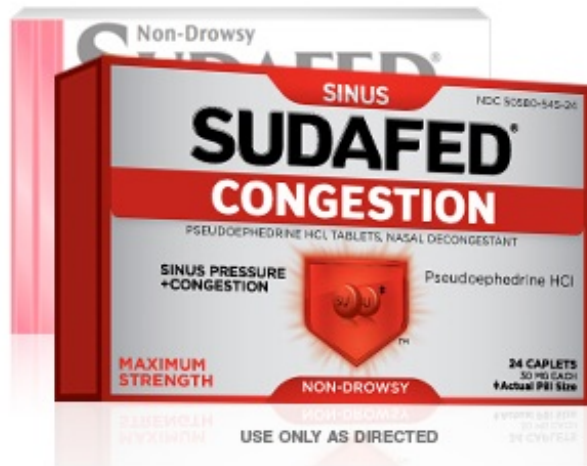
图 4. 盐酸伪麻黄碱