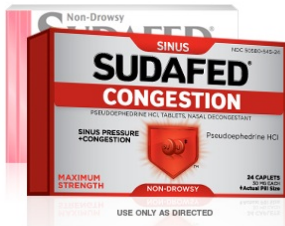
图 4. 盐酸伪麻黄碱