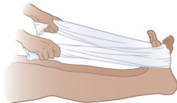
图 4. 脚部拉伸