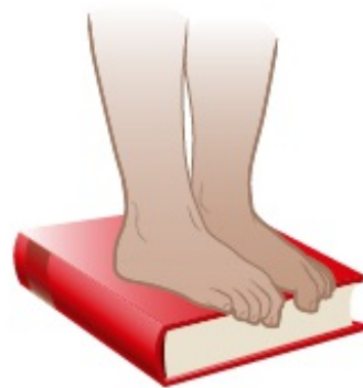
图 2. 使用书本进行脚趾卷曲练习