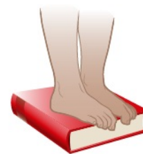
图 2. 使用书本进行脚趾卷曲练习