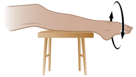
图 5. 脚踝转圈

如果您有任何问题或顾虑，请联系您的医疗保健提供者。医疗团队成员将在周一至周五 上午 9:00 至下午 5:00 给与回复。如在非上述时间段，您可以留言或与其他 MSK 服务提供者联系。随时有值班医生或护士为您提供帮助。如果您不确定如何联系医疗保健提供者，请致电 212-639-2000。