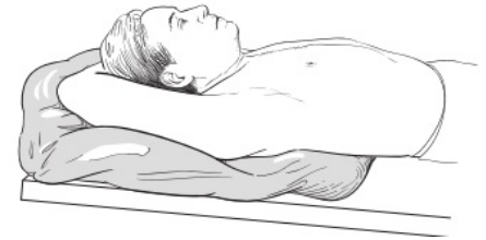
图 1. 在模具中的摆位

当您处于仰卧位时，您的待治疗部位将会接受 X 线摄影。它可以在被称为模拟器的 x 射线设备或计算机断层扫描 (CT) 设备上。如果您需要接受 CT 扫描，在扫描之前您可能需要通过静脉管线接受造影剂给药。这些扫描将仅用于描绘出您的治疗部位，并不会用于诊断或发现肿瘤。如果您需要接受其他影像检查，您的护士将向您解释具体信息。