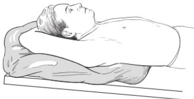
图 1. 在模具中的摆位

在整个模拟治疗过程中，您可能需要一直仰卧。当您躺在治疗床上的时候，将会根据您的上半身制作一个模具。您的放射治疗师会将温热液体倒入一个大塑料袋中，塑料袋将被密封并放置在治疗床上。您将躺在塑料袋上面，仰卧，双臂抬高至头部上方（见图 1）。液体最初会有温度，但它会随着变硬而冷却。液体冷却时，您的治疗师将会把该塑料袋贴在您的皮肤上，使其形成您的上半身和手臂的形状。这一过程大约需要耗时 15 分钟。